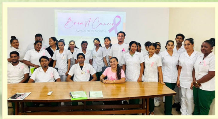
Samen Tegen Borstkanker: Kracht, steun en bewustwording