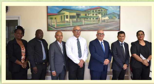
Stichtingsbestuur van het MMC