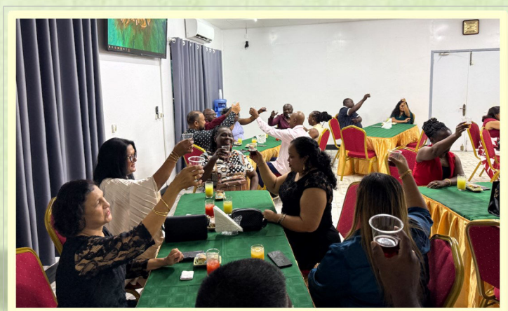
Het hoofden Dinner waar leiders samenkomen