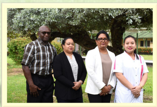
Directieteam van het MMC