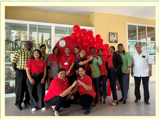
MMC Hearts Initiative voor een gezonder hart