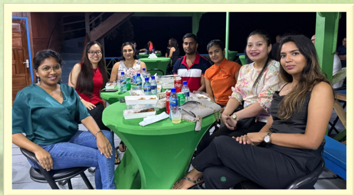
Het specialisten/ artsen dinner vol kennis en connecties