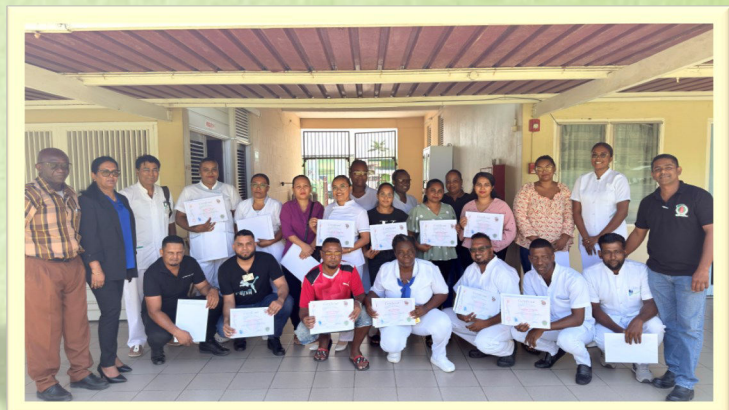
Initiatieven die onze community sterker maken