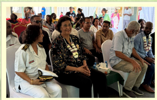
Presidentieel bezoek MMC