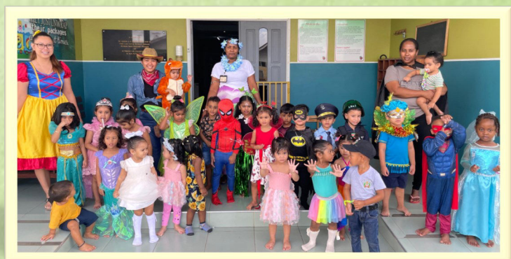
Kinderopvang vol plezier tijdens carnaval