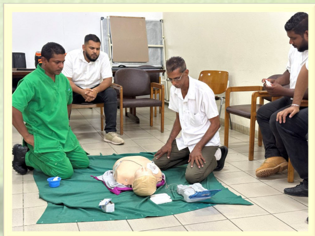
Reanimatietraining die levens kan redden